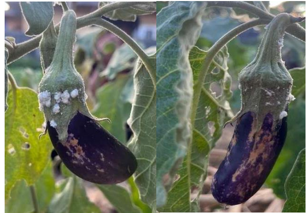
Gambar 9. Terong sesudah disemprot pestisida Nabati

Berdasarkan hasil pengamatan pada Gambar 7 dan Gambar 8, terlihat adanya perbedaan kondisi hama pada buah terong sebelum dan sesudah penyemprotan pestisida nabati. Pada kondisi sebelum penyemprotan, koloni hama berwarna putih terlihat menempel cukup banyak pada bagian tangkai dan permukaan buah terong. Keberadaan hama tersebut berpotensi mengganggu pertumbuhan tanaman serta menurunkan kualitas hasil panen.