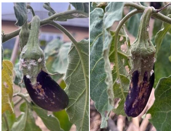
Gambar 8. Terong Sebelum Disemprot Pestisida Nabati

Tahap evaluasi dilakukan dengan memantau kondisi tanaman setelah dilakukan penyemprotan pestisida nabati. Tim KKN melakukan kunjungan lapangan secara berkala untuk mengamati perkembangan tanaman serta melihat efektivitas penggunaan pestisida nabati dalam mengurangi serangan hama.