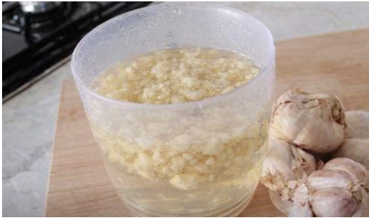
Gambar 5. Proses Ekstrak bawang putih