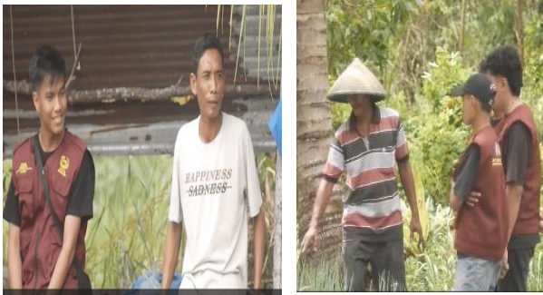
Gambar 2. Wawancara dengan petani