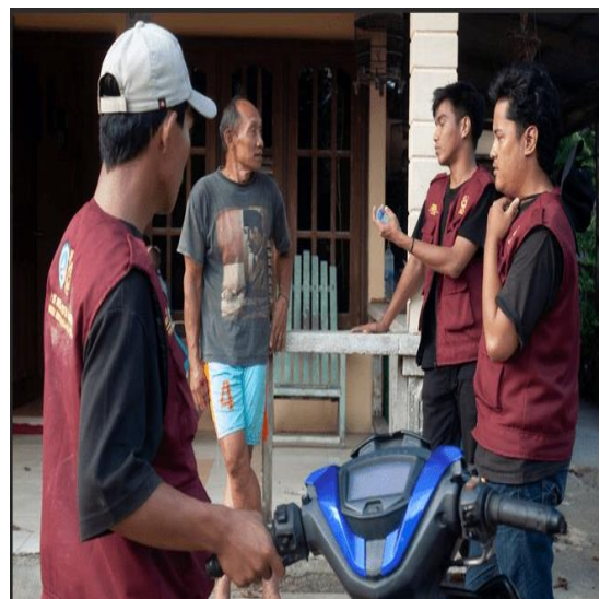
Gambar 7. Pemberian Edukasi Terkait Manfaat Pestisida Nabati Yang Sudah Diaplikasikan.

Selain pengaplikasian, tim KKN juga memberikan edukasi kepada petani mengenai cara pembuatan pestisida nabati, bahan-bahan yang digunakan, serta teknik penggunaan yang tepat. Petani diberikan penjelasan mengenai manfaat pestisida nabati sebagai alternatif pengendalian hama yang lebih aman bagi lingkungan serta dapat mengurangi ketergantungan terhadap pestisida kimia.