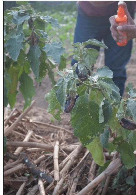
Gambar 6. Pengaplikasian Pestisida Nabati

Setelah larutan pestisida selesai dibuat, kegiatan dilanjutkan dengan pengaplikasian ke tanaman terong milik petani dengan metode penyemprotan pada bagian daun dan batang tanaman yang menunjukkan gejala serangan hama.