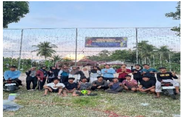
Gambar 1. Foto bersama mahasiswa KKN dengan perwakilan pemuda Desa Rambai setelah persiapan lapangan futsal

Pada tahap ini, mahasiswa KKN melakukan koordinasi awal dengan kepala desa dan tokoh masyarakat Desa Rambai dan penyerahan proposal kegiatan turnamen untuk menyampaikan rencana kegiatan dan memperoleh dukungan serta izin pelaksanaan. Selanjutnya dilakukan survei lapangan untuk membersihkan lokasi pertandingan, penyusunan bagan tim peserta turnamen, penyusunan jadwal turnamen, penetapan peraturan pertandingan, serta pengadaan perlengkapan yang dibutuhkan seperti bola, gawang, rompi tim, dan hadiah kejuaraan.