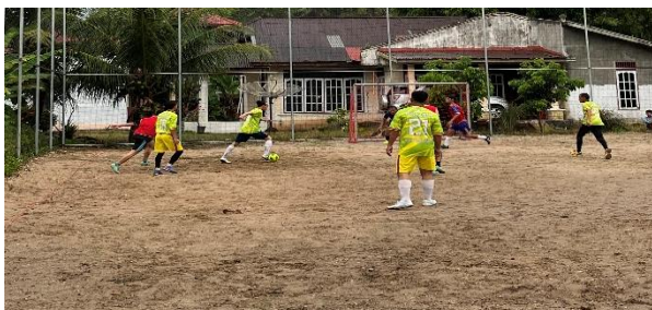
Gambar 4. Pelaksanaan turnamen futsal

Turnamen futsal dilaksanakan dengan sistem gugur selama 2 hari dari tanggal 30-31 Januari 2026, menyesuaikan jumlah 12 tim yang mendaftar. Setiap pertandingan dipimpin oleh wasit profesional yang telah ditentukan sebelumnya guna memastikan jalannya pertandingan berlangsung tertib, adil, dan sportif. Selama pelaksanaan, mahasiswa KKN UNP berperan sebagai panitia penyelenggara yang bertanggung jawab atas kelancaran teknis pertandingan dan dokumentasi kegiatan.