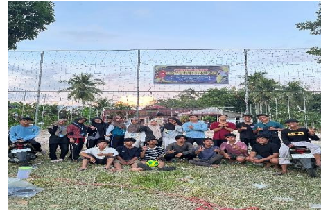
Gambar 1. Foto bersama mahasiswa KKN dengan perwakilan pemuda Desa Rambai setelah persiapan lapangan futsal

Pada tahap ini, mahasiswa KKN melakukan koordinasi awal dengan kepala desa dan tokoh masyarakat Desa Rambai dan penyerahan proposal kegiatan turnamen untuk menyampaikan rencana kegiatan dan memperoleh dukungan serta izin pelaksanaan. Selanjutnya dilakukan survei lapangan untuk membersihkan lokasi pertandingan, penyusunan bagan tim peserta turnamen, penyusunan jadwal turnamen, penetapan peraturan pertandingan, serta pengadaan perlengkapan yang dibutuhkan seperti bola, gawang, rompi tim, dan hadiah kejuaraan.