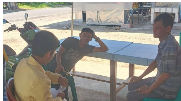
Gambar 2. Sosialisasi serta penyampaian informasi kepada tetua masyarakat desa Rambai

Sosialisasi dilakukan secara langsung melalui pertemuan dengan pemuda dan tetua desa, penyebaran informasi dari mulut ke mulut, serta pemasangan brosur di titik-titik strategis di Desa Rambai. Sosialisasi dilakukan 7 hari sebelum turnamen dimulai. Pada tahap ini, mahasiswa KKN UNP menjelaskan tujuan kegiatan, mekanisme pendaftaran tim, sistem pertandingan yang digunakan, serta peraturan yang wajib dipatuhi oleh seluruh peserta.