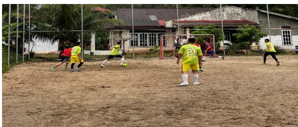
Gambar 4. Pelaksanaan turnamen futsal

Turnamen futsal dilaksanakan dengan sistem gugur selama 2 hari dari tanggal 30-31 Januari 2026, menyesuaikan jumlah 12 tim yang mendaftar. Setiap pertandingan dipimpin oleh wasit profesional yang telah ditentukan sebelumnya guna memastikan jalannya pertandingan berlangsung tertib, adil, dan sportif. Selama pelaksanaan, mahasiswa KKN UNP berperan sebagai panitia penyelenggara yang bertanggung jawab atas kelancaran teknis pertandingan dan dokumentasi kegiatan.